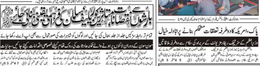
دوران اجتماع گرفتار ایران کی رہائی، لوز شینگ کا خاتمہ، جنگی جرائم میں تمام مجسروں، پندرہویں فورم ایکٹ کا خاتمہ، مطالبات میں شامل، رہائی کا آغاز میں ایک اہم ایجنڈا لوانگ کے قریب چوک کے پاس کیا گیا۔

پاک، امریکہ کا دو طرفہ تعلقات مستحکم بنانے پر تبادلہ خیال۔ وزیر اعظم کے سربراہی میں ایک وفد نے امریکہ میں ایک وفد سے ملاقات کی۔