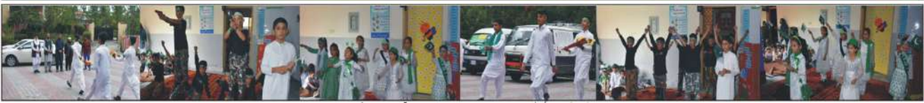
راولاکوٹ: مسلم پروڈکٹس ایف ایس ایس راولاکوٹ میں پاکستان کے کھجور بیو پی ایم آزادی کے موقع پر بچے، ٹیچر اور کارکنوں نے تقریب منعقد کی۔