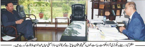
مظفر آباد: چیف کوریڈر حکومت، ریاست میں، شیخ رحمان چاچہ نے ہزاروں سالہ ساریاں میں ملازمین کا دورہ کیا۔

ڈاکٹر اوچی ازان 86 روپے ڈاکٹر اوچی ازان 86 روپے پر ایک پروگرام جاری ہے۔