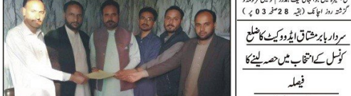
راولاکوٹ: ایک گروپنگ میں شرکت کرنے والے افراد کی تصویر۔

پانچویں شہر میں شادی المیہ پانچویں شہر میں شادی المیہ منائی گئی ہے۔