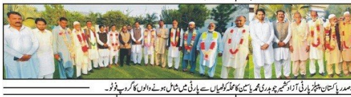
راولاکوٹ: ایک گروپنگ میں شرکت کرنے والے افراد کی تصویر۔

مسلم کانفرنس کا درخواستوں کی وصولی کیلئے شیڈول جاری مسلم کانفرنس نے درخواستوں کی وصولی کیلئے شیڈول جاری کیا ہے۔