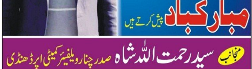
راولاکوٹ: ایک گروپنگ میں شرکت کرنے والے افراد کی تصویر۔

پندرہویں شہر میں شادی المیہ پندرہویں شہر میں شادی المیہ منائی گئی ہے۔