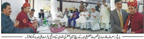
راولاکوٹ: ایک گروپنگ میں شرکت کرنے والے افراد کی تصویر۔

بی بی سی کے ڈومو عوام سب پر مایاں ہو چکے ہیں، محبوبہ مفتی محبوبہ مفتی نے بی بی سی کے ڈومو عوام سب پر مایاں ہو چکے ہیں، محبوبہ مفتی نے کہا ہے۔