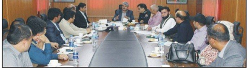
مظفر آباد: گورنر جنرل صاحب نے گورنر صاحب کے ہمراہ مختلف اداروں کی نمائندگی کی۔

سعودی عرب، پیٹریوٹک لیگن مبارک کی شہر فائز کیلئے پیش فائز کا بنیادی مقصد ہی ہر ماہ کیلئے ایک نئے اور تازہ ترین پروگرام پیش کرنا ہے۔